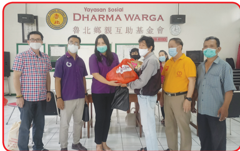
Pemberian paket sembako.