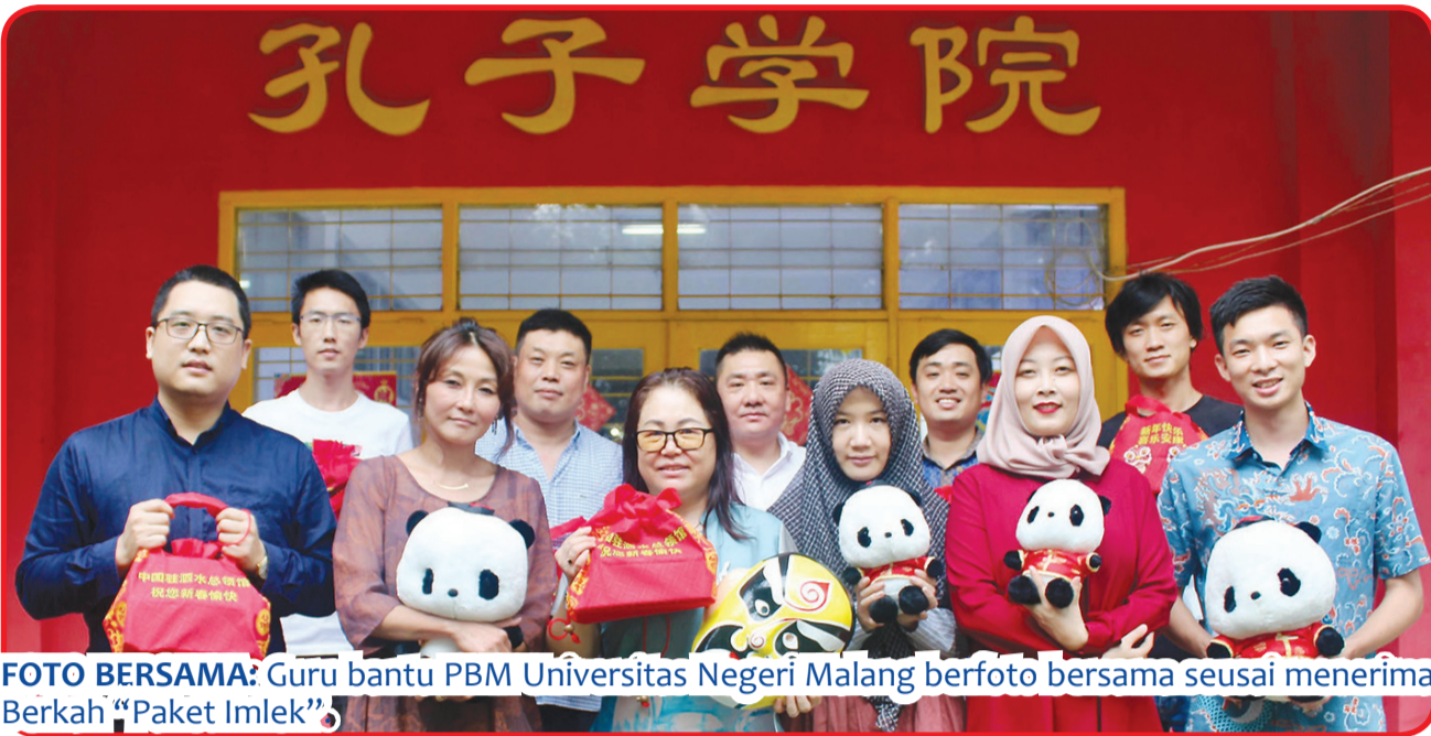
FOTO BERSAMA: Guru bantu PBM Universitas Negeri Malang berfoto bersama se usai menerima Berkah "Paket Imlek".