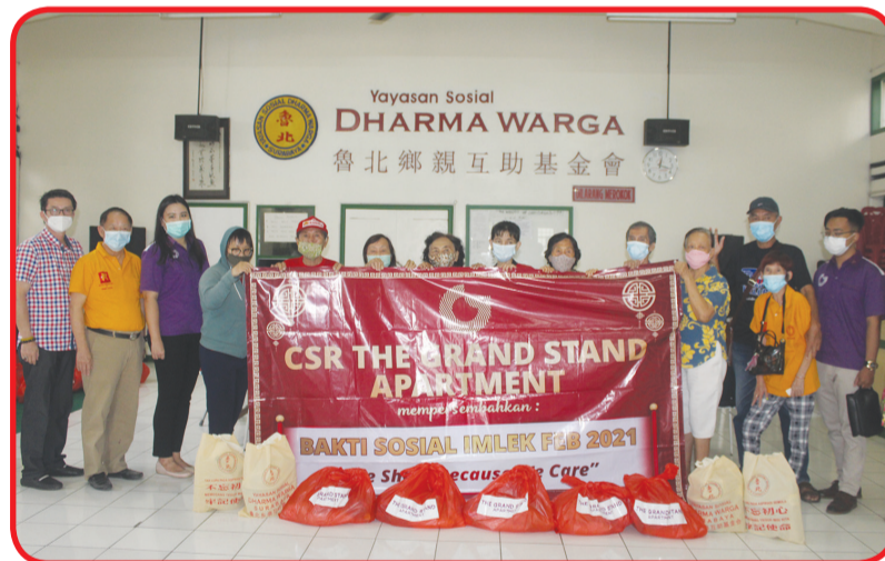
Pengurus yayasan dan anggotanya bersama CSR The Grand Stand Apartmen.

SURABAYA (IM) - Pengurus Yayasan Sosial Dharma Warga setiap kali perayaan Imlek rutin memberikan sembako dan angpao.