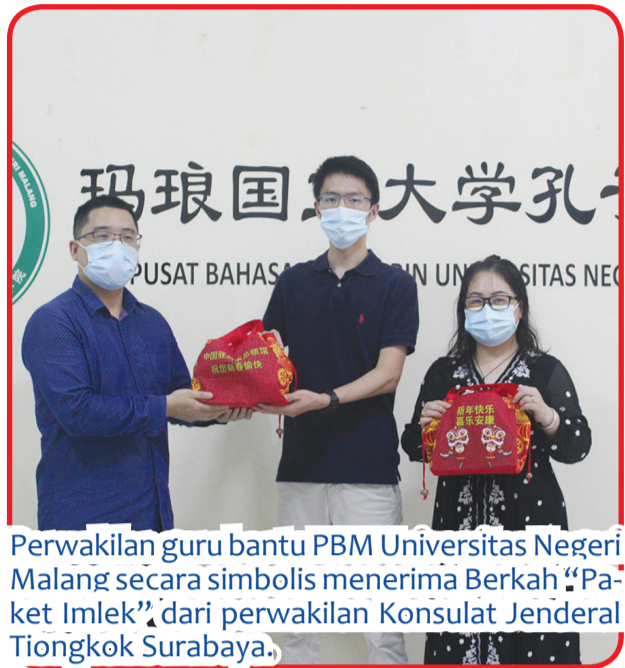
Perwakilan guru bantu PBM Universitas Negeri Malang secara simbolis menerima Berkah "Paket Imlek" dari perwakilan Konsulat Jenderal Tiongkok Surabaya.

MALANG (IM) - Dalam beberapa hari terakhir, Kedubes Tiongkok di Indonesia mengirimkan Berkah "Paket Imlek" kepada warga negara Tiongkok yang merayakan Tahun Baru Imlek di Indonesia. Tampak pada foto para guru bantu Tiongkok PBM Universitas Negeri Malang pada Rabu (3/2) lalu menerima kiriman Berkah "Paket Imlek" dari Konsulat Jenderal Tiongkok Surabaya. Kemudian foto berikutnya menunjukkan para guru PBM Universitas Negeri Malang setelah menerima Berkah "Paket Imlek" yang dikirimkan Konsulat Jenderal Tiongkok Surabaya. Mereka menyatakan rasa terimakasihnya kepada tanah air Tiongkok. • idn/din