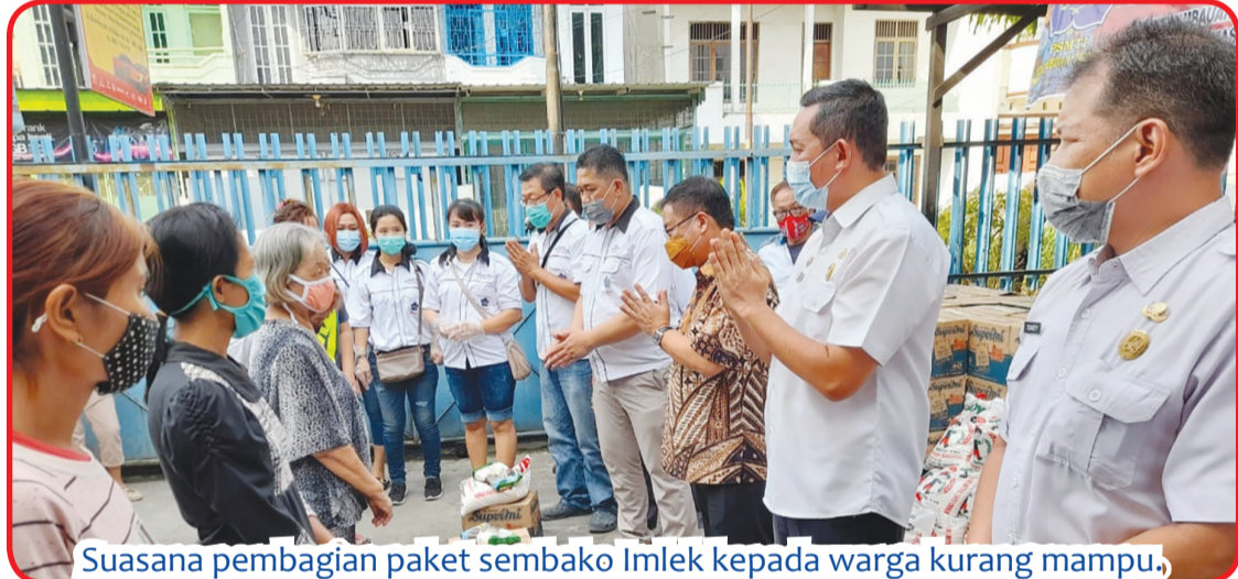
Suasana pembagian paket sembako Imlek kepada warga kurang mampu.